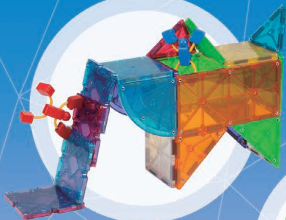
ゾウさんアスレチック