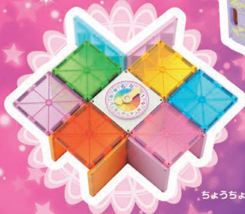
ちょうちよどけい