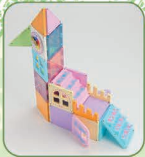
ななめうえからみると…